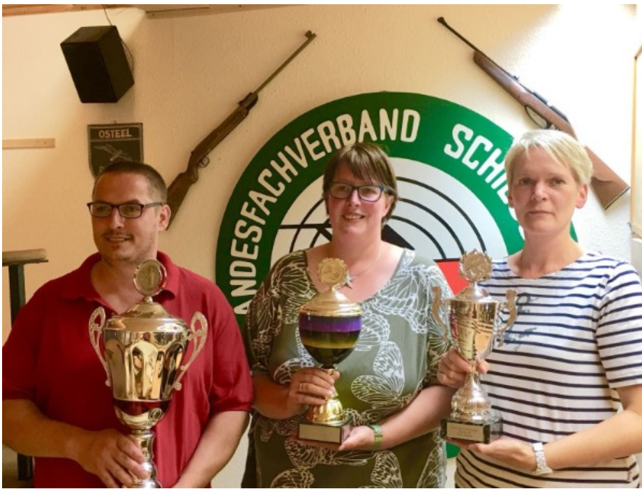
Für den SSV Norderney Pressewart: Anke Schenk